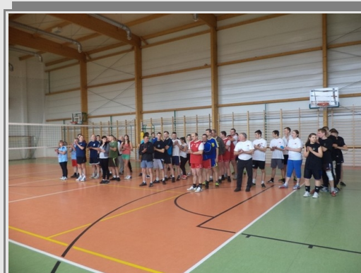
Turniej piłki siatkowej