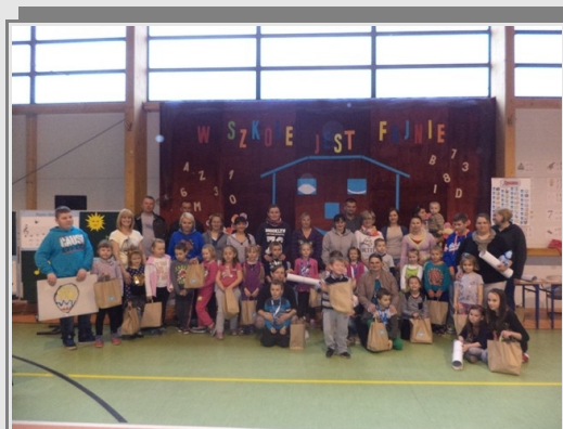
Sześciolatki do szkoły