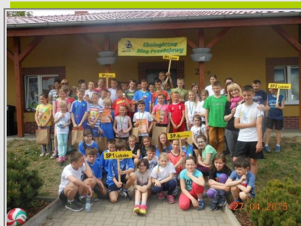
Uczestnicy Międzyszkolnego Biegu Przełajowego z okazji Dnia Ziemi