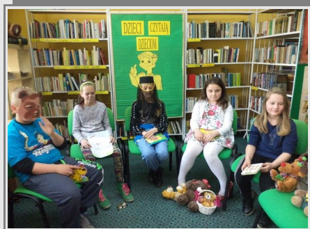
Uczniowie klasy III w przebraniach przedstawiających czytany tekst