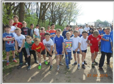
Uczestnicy biegu gotowi do startu