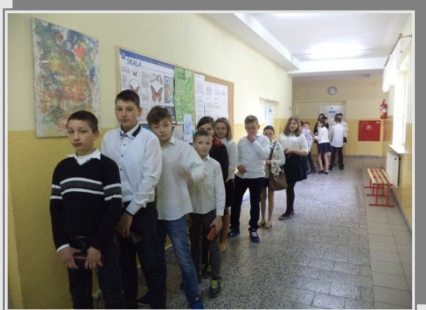
Grupa szóstoklasistów przed wejściem do klasy