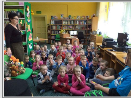
Najmłodszy w szkole odbiorcy przygotowani do niezwyklej prezentacji książek