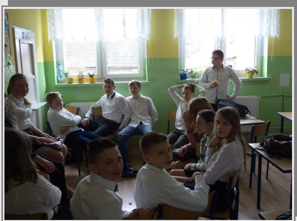
W grupie różnej...Uczniowie klasy VI w oczekiwaniu na sprawdzian