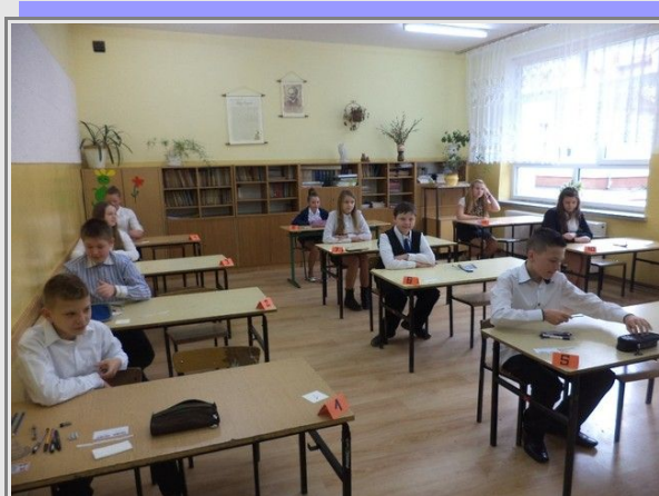
Uczniowie klasy VI na chwilę przed otwarciem testów

1 kwietnia szóstoklasiści pisali sprawdzian, po raz pierwszy również z języka obcego.