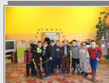
Przedszkolaki i dzieci z klas pierwszych w czasie karnawałowych zabaw