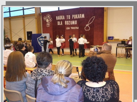
Występy uczniów z klasy III przed rozdaniem listów gratulacyjnych