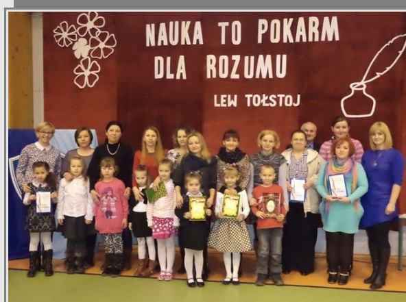
Najlepsi, najmłodsi uczniowie naszej szkoły z rodzicami, dyrektorem szkoły i wychowawcą