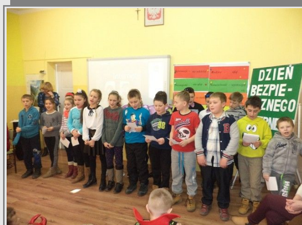
Uczniowie klasy III śpiewają piosenkę „Dobre rady” na spotkaniu z okazji „Dnia bezpiecznego Internetu”