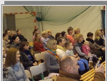
Rodzice wyróżnionych dzieci