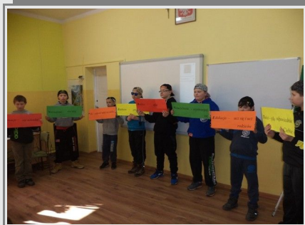
Chłopcy klasy V prezentują zasady bezpiecznego korzystania z Internetu