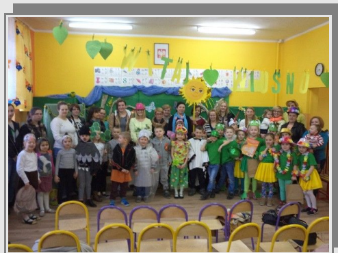
Pierwszoklasiści na wspólnym zdjęciu z rodzicami