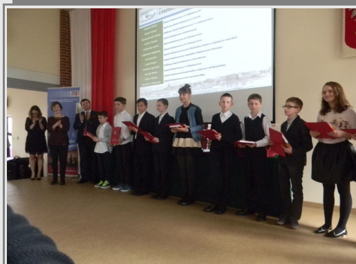
Laureaci konkursów przedmiotowych