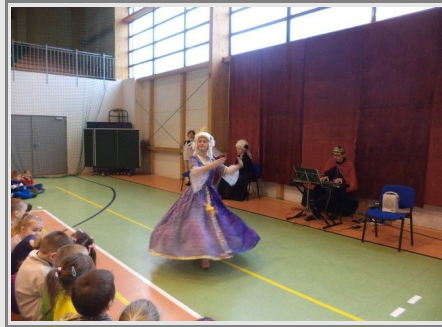
Dzieci mogły zobaczyć jak tańczono menueta na dworach królewskich