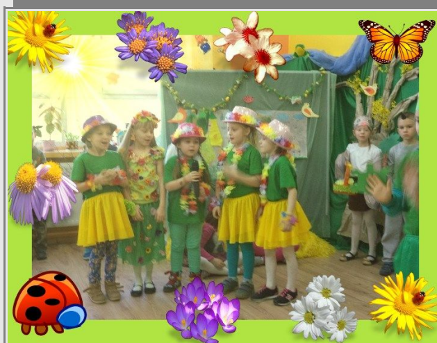
Dzieci klas pierwszych w przedstawieniu „Witaj wiosno”