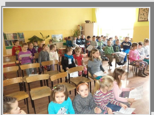
Grupa dzieci młodszych przygotowuje się do wspólnego śpiewania