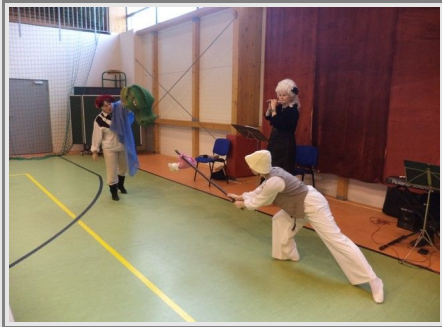
Artyści w przedstawieniu „Jak szewczyk Dratewka pokonał wawelskiego smoka”