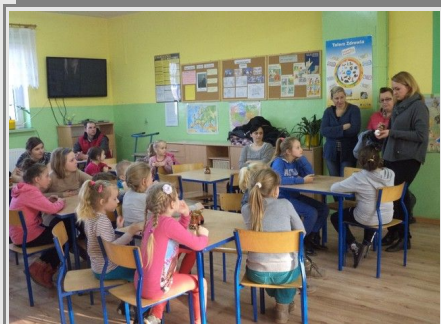
Dzieci z rodzicami na warsztatach

16 marca dzieci naszej szkoły wraz z rodzicami wzięli udział w warsztatach malowania pisanek. Zajęcia te przygotowało i zorganizowało Stowarzyszenie „Lokalna Grupa Działania – Grupa Łużycka”. Warsztaty pod hasłem Święto Tradycji Wielkanocnych odbyły się w świetlicy szkolnej. Organizatorzy przygotowali dla dzieci potrzebne materiały do wykonania pisanek: wydmuszki i wosk. W warsztatach wzięło udział 25 dzieci i kilkoro rodziców.