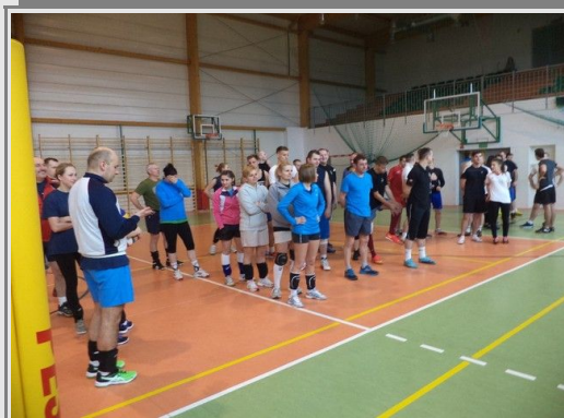
Drużyny przed walką